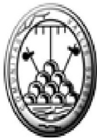
Comunità Montana Valsabbia