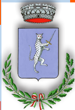
Comune di Gavardo